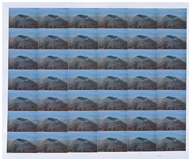
Figura 1. Giannetto Bravi, Paesaggio ripetuto n. 3 , 1975, 42 cartoline, 100 x 80 cm. Collezione Museo MAGA, Gallarate.

Già alla metà di quel decennio 1 la ricerca di Bravi si assesta su questo registro espressivo: egli riporta su tela immagini fotografiche che possono essere di differenti soggetti, di diverse provenienze – colte dall'immaginario collettivo, dalla comunicazione mediatica o dall'universo artistico – e le dispone semplicemente in sequenze seriali, ripetendo sempre la stessa figura, nella maggior parte dei casi senza intervenire in altro modo.