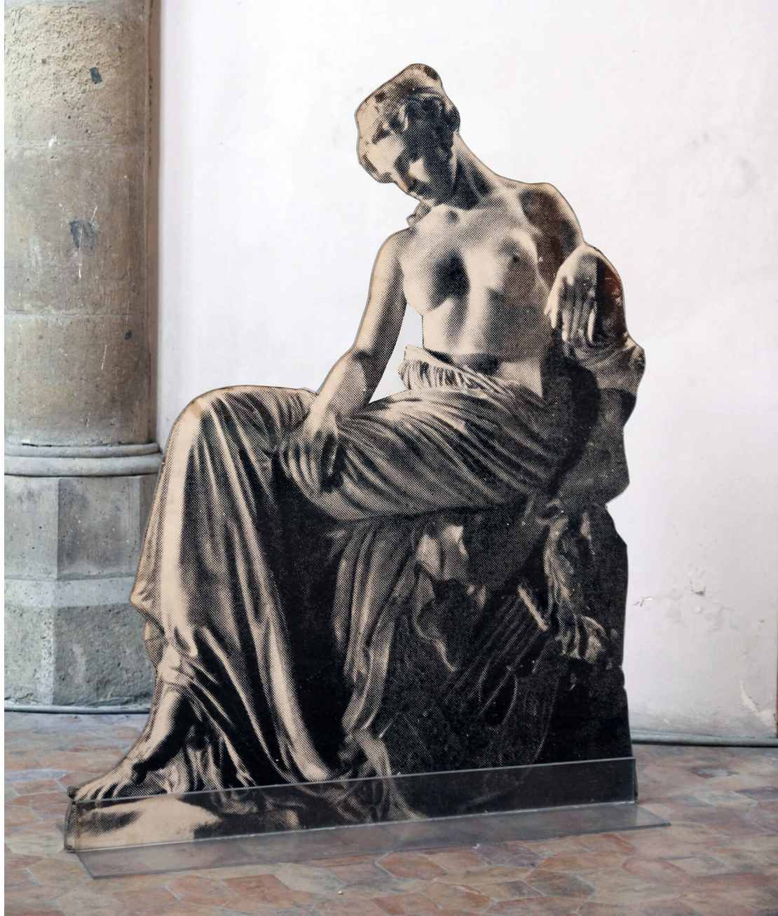
Figura 5. Giulio Paolini, Saffo , 1968, fotografie montate tra sagome di plexiglas, supporto di plexiglas, 146 x 116.5 x 35 cm. Collezione Berlingieri. © Giulio Paolini.