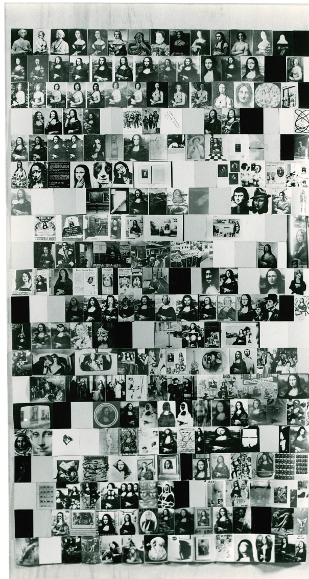
Figura 2. Adriano Altamira, 160 Gioconde , 1975 – 1976, fotocollage. Giappone, collezione privata.