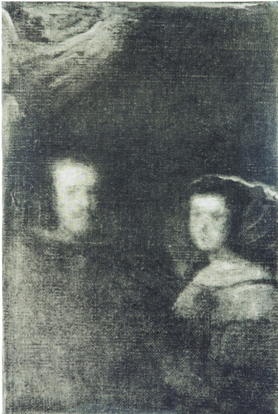
Figura 4. Giulio Paolini, L'ultimo quadro di Diego Velázquez , 1968, fotografia su tela emulsionata 93 x 62 cm. Collezione Consolandi, Milano. © Giulio Paolini. Foto Roberto Marossi, Courtesy Fondazione Giulio e Anna Paolini, Torino.