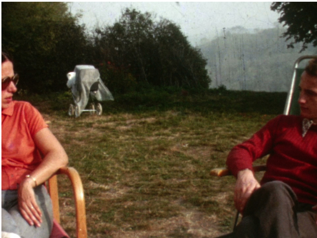
Figura 3. Fotogramma di Il quadrato. Definizione di spazio (8mm, 1972) di Tonino De Bernardi, rimediazione del 2018.