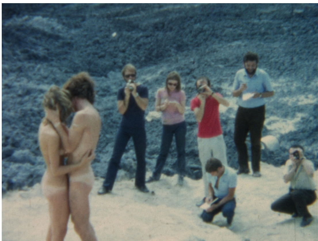
Figura 6. Fotogramma di Amarsi a Marghera (Il bacio) (8mm, 1970) di Sirio Luginbühl, ristampato in 16mm (2018) e proiettato in loop nella sala d'ingresso della mostra. Sirio Luginbühl: Film sperimentali, Cittadella (PD), 15 aprile – 15 luglio 2018.