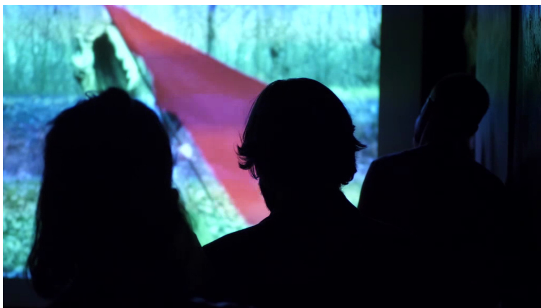
Figura 7. Fotografia dell'installazione di La Bandiera (8mm, 1970) di Sirio Luginbühl: viene evidenziato lo spazio immersivo che avvolge i visitatori, scelta curatoriale permessa dalla versatilità della rimediazione digitale. Sirio Luginbühl: Film sperimentali, Cittadella (PD), 15 aprile-15 luglio 2018.

del periodo: carteggi, cataloghi, programmi di sala, poster, volumi. Materiali come questi, appesi o esposti in bacheca, sono fondamentali sul piano storiografico e il fatto che siano presenti allarga il campo visivo della proposta. Si pensi solo alle grafiche utilizzate. Nel complesso, tali documenti sono essenziali per ricostruire un pezzo di storia del cinema italiano che fino a pochi anni fa è stato negato e rimosso.