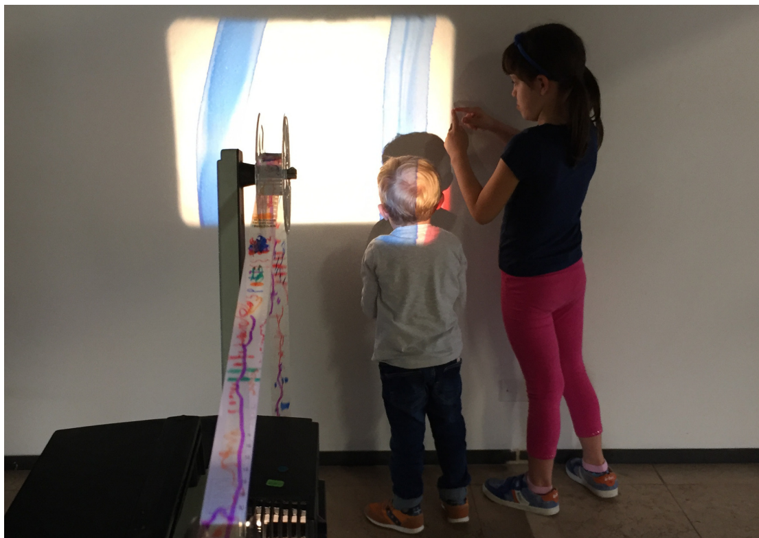
Figura 5. Fotografia del laboratorio didattico. I "nativi digitali" sono avvicinati alla materialità della pellicola e ai dispositivi analogici di proiezione. Sirio Luginbühl: Film sperimentali , Cittadella (PD), 15 aprile – 15 luglio 2018.

anch'esse prevalentemente in pellicola, di opere di artisti e filmmaker italiani e internazionali per favorire la ricostruzione del contesto di influenze e scambi in cui opera Luginbühl, nonché da laboratori didattici, rivolti ai bambini, dedicati alla manipolazione e al disegno su pellicola. 17